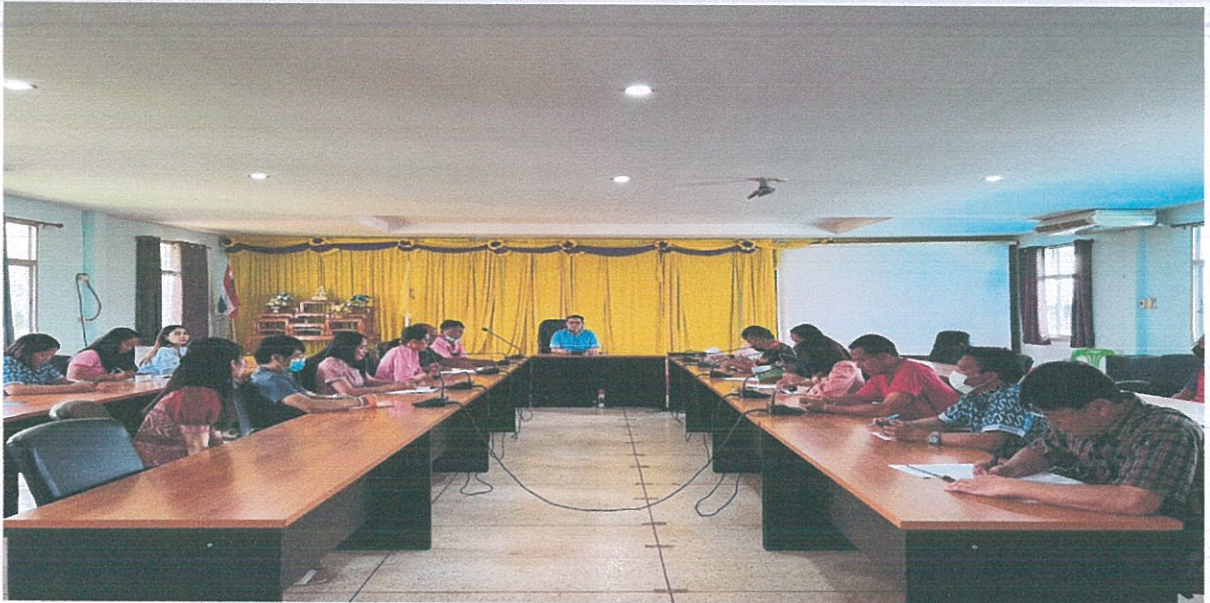
ประชุมประจำเดือนพนักงานองค์การบริหารส่วนตำบลนาสะอาด