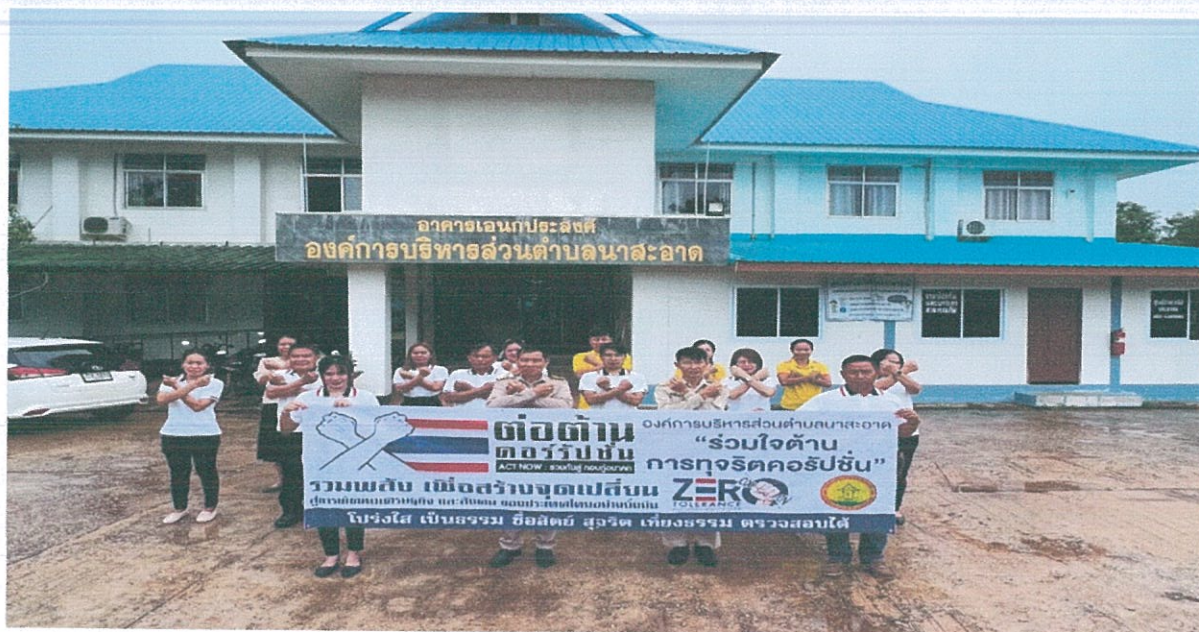
กิจกรรมปลูกจิตสำนึกสร้างวัฒนธรรมองค์กร (No Gift Policy)