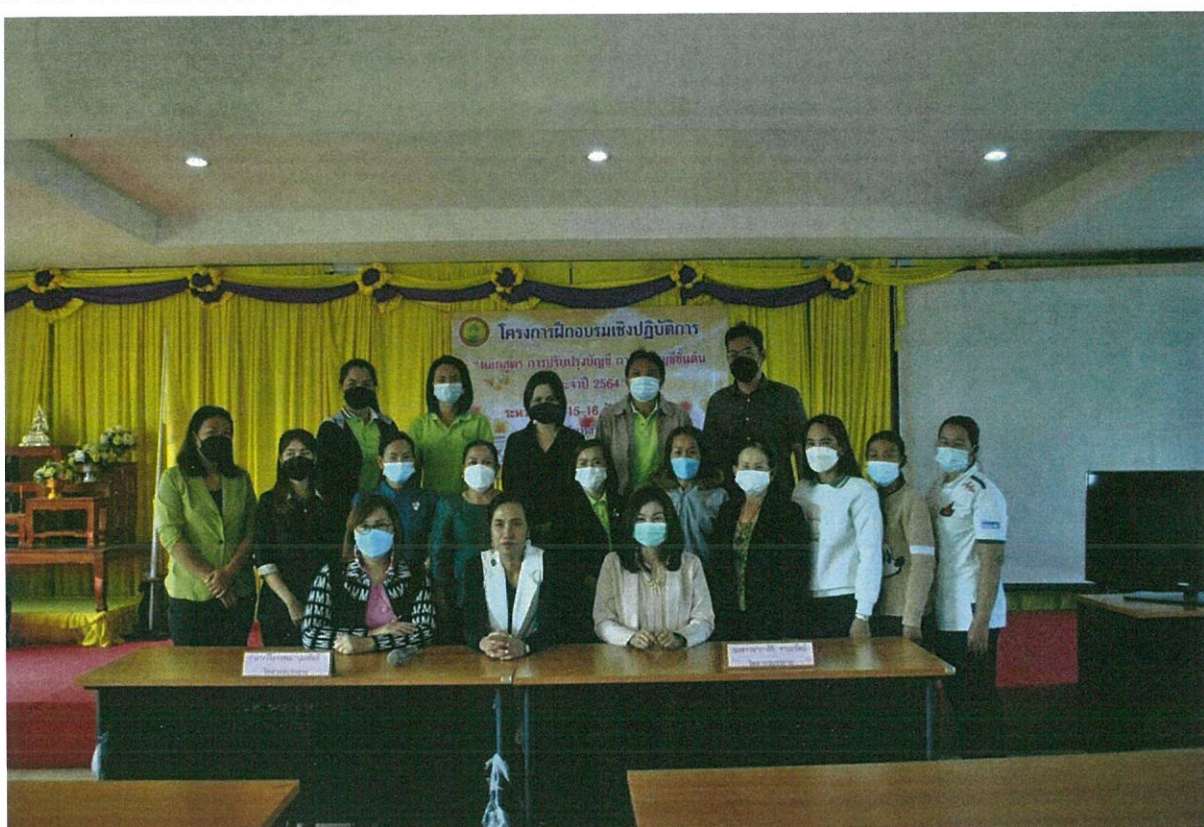
ภาพที่ 4.4 กิจกรรม/โครงการขององค์การบริหารส่วนตำบลนาสะอาด อำเภอสร้างคอม (4)