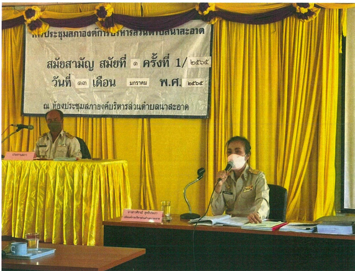
ภาพที่ 4.1 กิจกรรม/โครงการขององค์การบริหารส่วนตำบลนาสะอาด อำเภอสร้างคอม (1)

สุดท้าย ด้านการทำแบบสำรวจและประเมินความพึงพอใจในการให้บริการขององค์กรปกครองส่วนท้องถิ่น พบว่า กลุ่มตัวอย่างทั้งหมดไม่เคยทำแบบสอบถามประเมินความพึงพอใจการให้บริการขององค์กรปกครองส่วนท้องถิ่น ร้อยละ 100 รายละเอียดตามตารางที่ 4.1